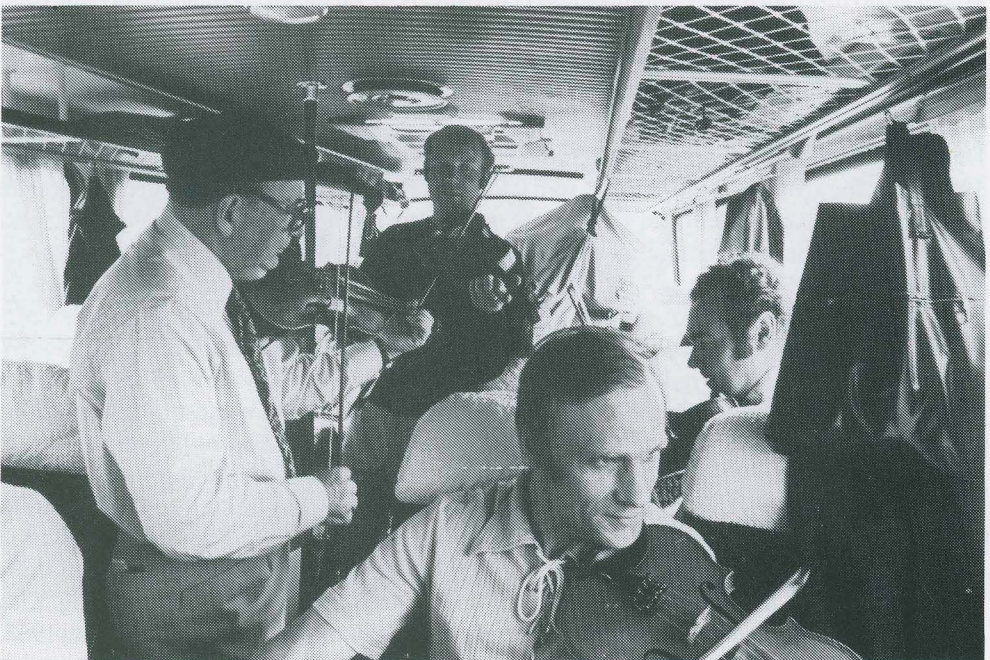
Buskspel i bussen. Nyländska spelmän på väg till spelmansstämman i Nykarleby 1977.