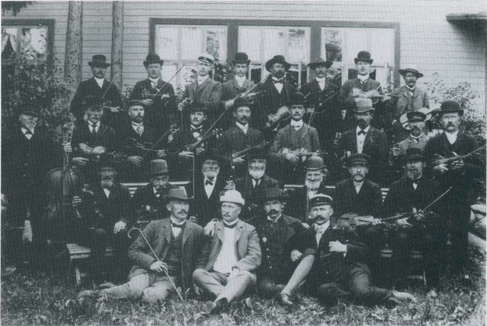
Deltagarna vid spelmanstävlingen i Mariehamn 1908.