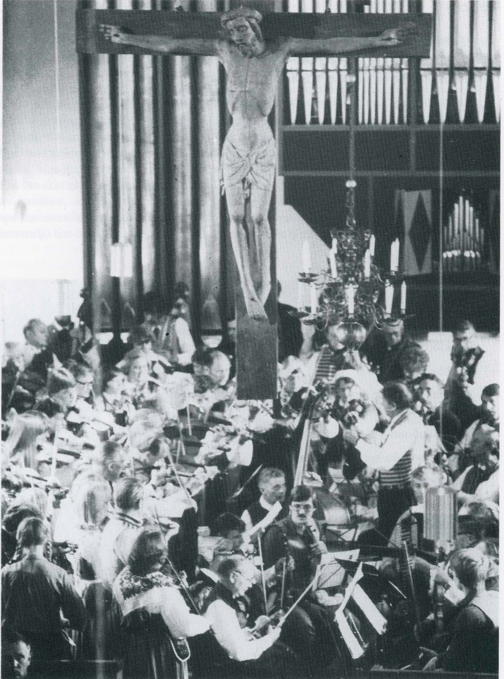
En viktig ingrediens på en spelmansstämma är kyrkspelet. Bilden är från Närpes 1980.