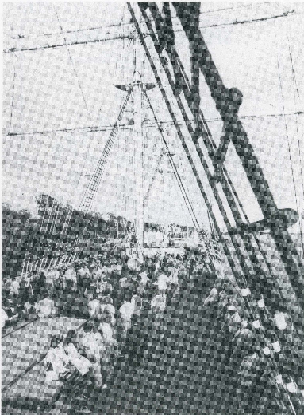
Dans på Pommerns däck - spelmansstämman i Mariehamn 1986.